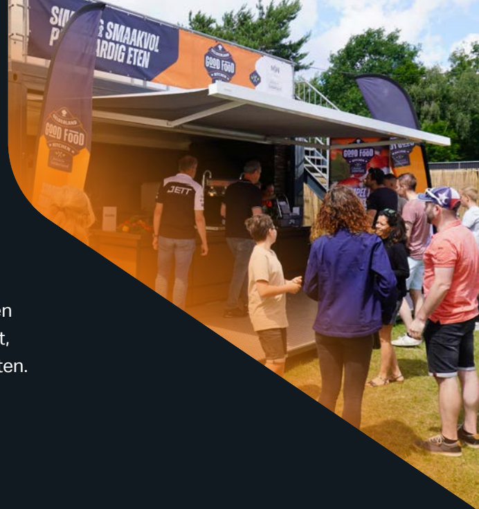
Ingrediënten kan ik makkelijk vinden in de supermarkt