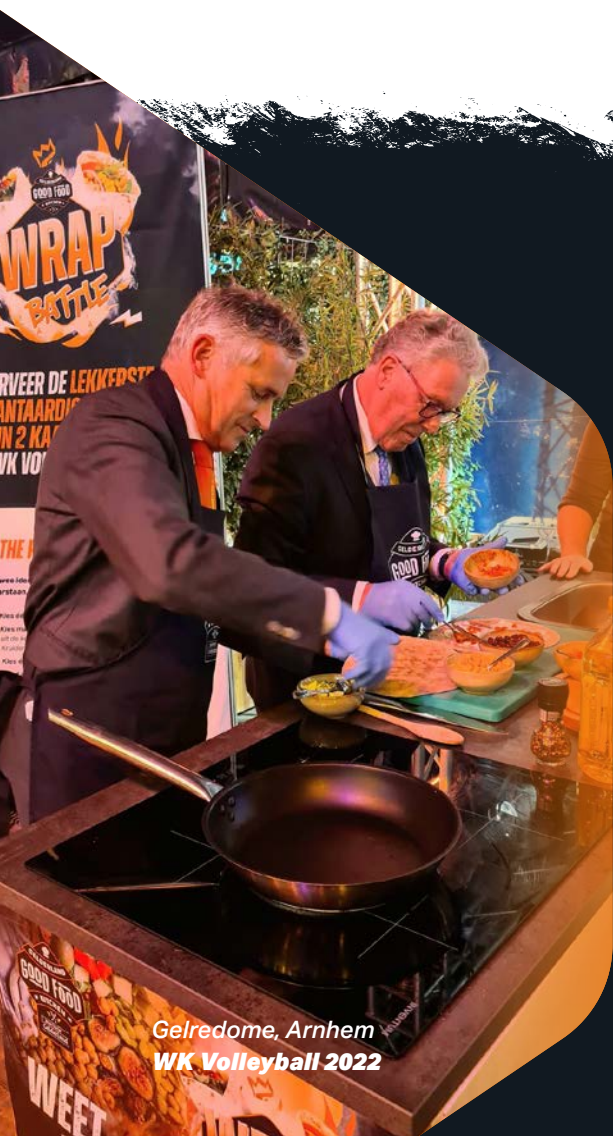
Gelredome, Arnhem WK Volleyball 2022

Het concept biedt vanwege het enthousiasme en het draagvlak potentie voor structurele verandering.